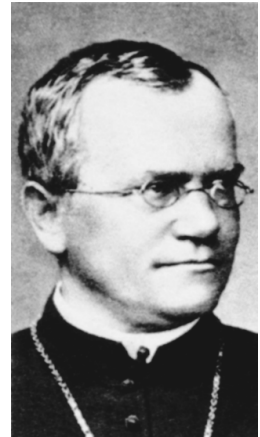
Abb. 71: GREGOR MENDEL

Bestäubung: Übertragung von Blütenstaub (Pollen) auf die Narbe des Frucht- knotens