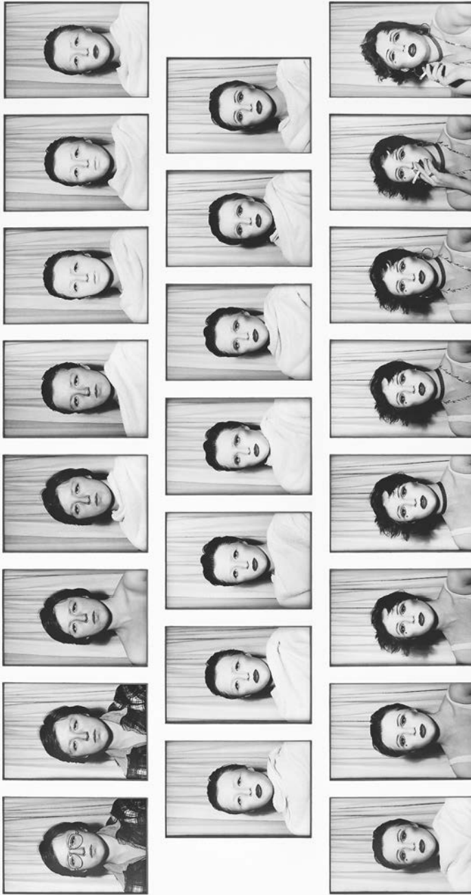
Abb. 2: Cindy Sherman, Untitled #479, 1975