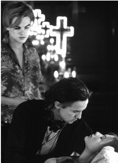
Filmszene aus William Shakespeare's Romeo + Juliet (1996) mit Leonardo DiCaprio, Paul Rudd und Claire Danes (von links)

Die letzte Szene des Stücks schildert das Ende von Paris, Romeo und Juliet. Die Familien und der Fürst kommen hinzu und Laurence, dessen zu spätes Eintreffen die Katastrophe erst ermöglicht, schildert die Vorgänge dem Fürsten, welcher Capulet und Montague dazu bringt, Frieden zu schließen.